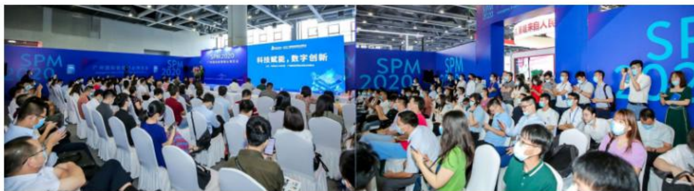
新物业80后创新者论坛