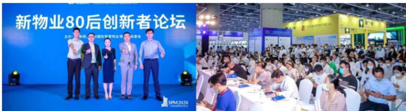
物业数字“破圈”——驱动利润增长的数字化引擎