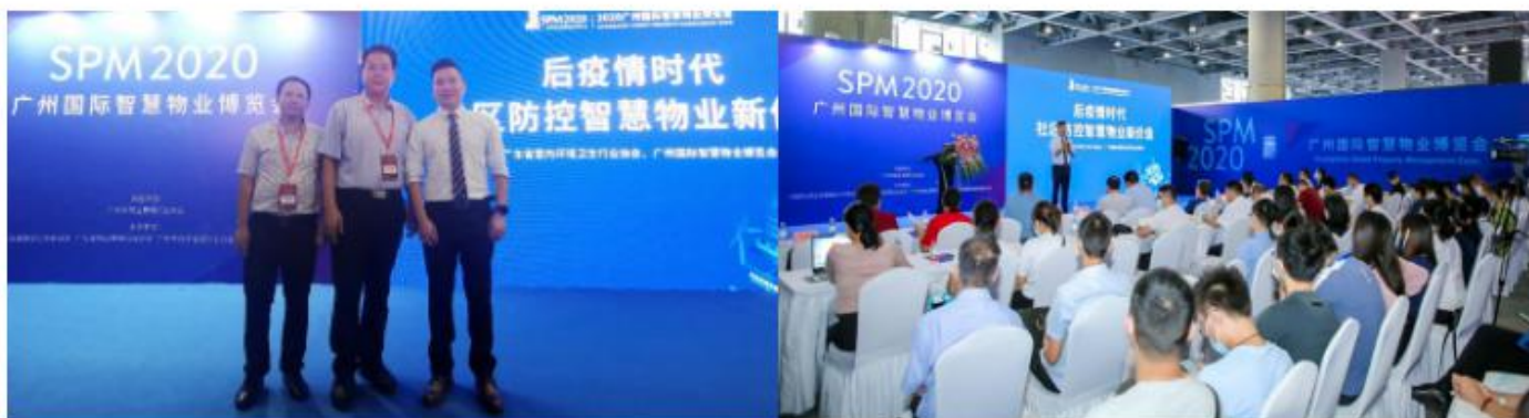
科技赋能，数字创新