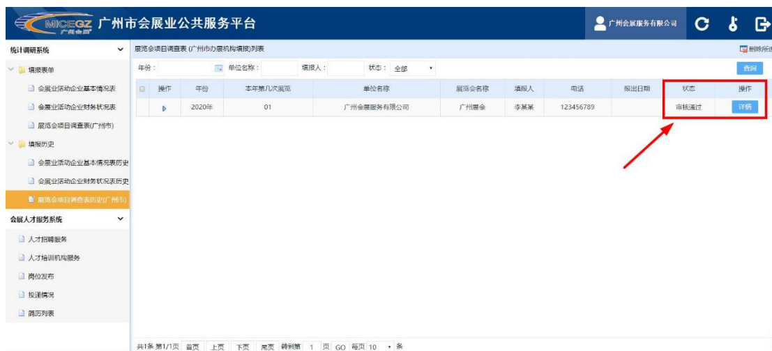
表单通过审核后状态为“审核通过”

撤销审核： 点击页面右上角红色按钮【撤销审核】可停止审核流程，并撤回表单进行修改。