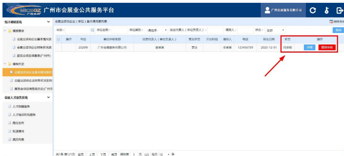
表单在审核期间状态为“待审核”